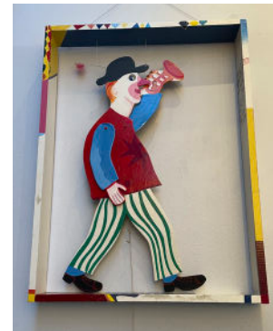
Down by the riverside, trä, metall, snöre, 1980, 93x70 cm, 15.000:-