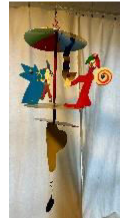
Cirkus-mobil, metall, plexi, cernitlera, 1995, 60 cm, 4000:-