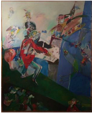
Cityjazz G.L. Unit, olja, 1970-74, 199x160 cm, 25.000:-