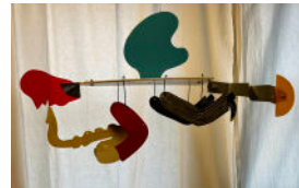
Saxofonist 3, metall, plexi, plywood, 80 cm, 1996, 5000:-

VERKEN ÄR TILL SALU kontakt; calle@riche.se