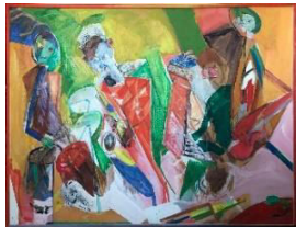
Lester leaps in, 1983- 84, 95x124 cm, 15.000:-