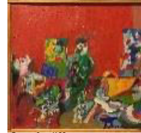
Jazzkväll, olja, 1975, 36x38 cm, 4.500:-