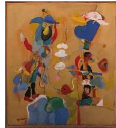
Jazz I Park Guell, 2001, 74x66 cm, 13.000:-