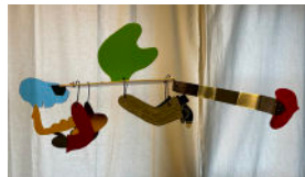
Saxofonist 2, metall, plexi, plywood, 80 cm, 1996, 5000:-