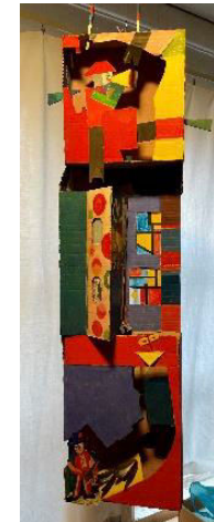
Utoparen, kartong, trä, plast, 1973, 85 cm, 6000:-