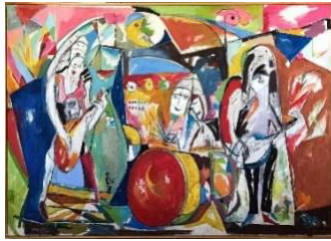
Dead Moon, 1996, 97x135 cm, 30.000:-