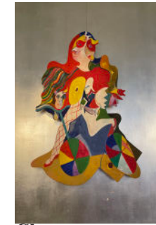
Clown, plywood, 2000-tal, 105 cm, 7000:-