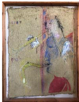
Chet and Stan, 1980-tal, 101x79 cm, 13.000:-