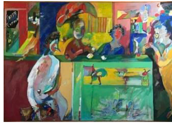
Café Halvvejen, 1980, 91x140 cm, 17.000:-