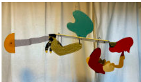
Saxofonist 1, metall, plexi, plywood, 80 cm, 1996, 5000:-