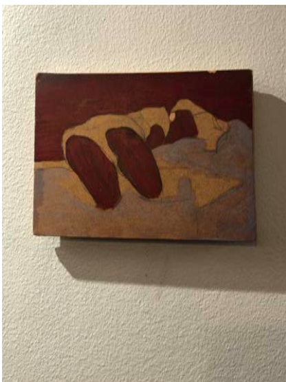
“Fragmented Intimacy 1” Oljemålning på pannå. 2017. 12 x 17 cm