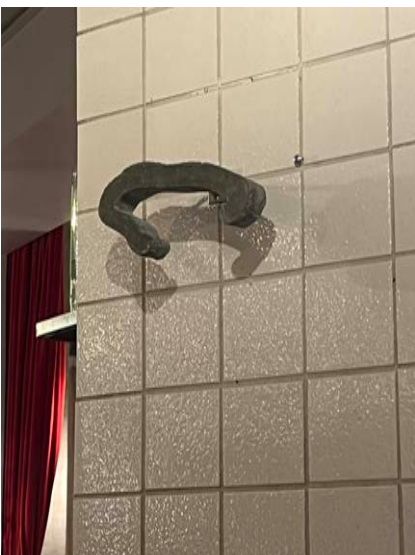
"Gest 1" Armerad betong. 2022 ca 15 x 10 x 10 cm