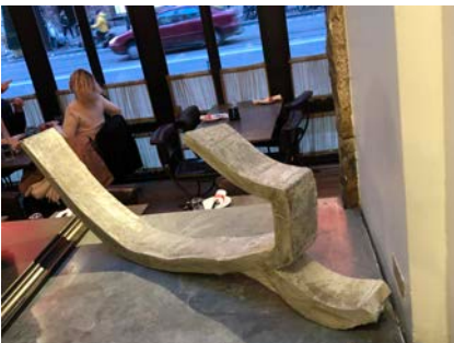
"Curve" Skulptur, Armerad betong. 2022. 90 x 10 cm