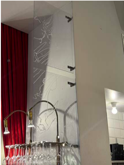
"Plain Sight" Diptyk av Plexiglas. 2022. 50 x 25 cm styck