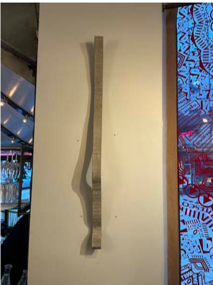
"Untitled" Väggskulptur, Armerad Betong. 2022. 90 cm