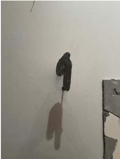
"Gest 2" Armerad betong. 2022. ca 12x 6 x 10