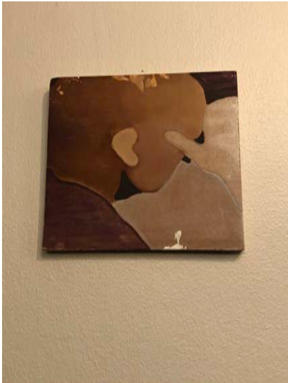
"Fragmented Intimacy 2" Oljemålning på pannå. 2017. 12 x 17 cm