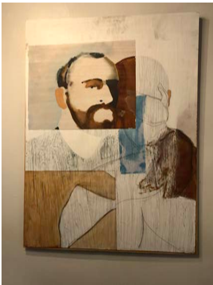
“Blå/Vi” Oljemålning på pannå. 2017. 100 x 70 cm