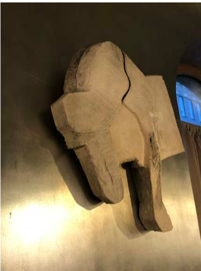
"Desire Lines 2" Frigolit, Jesmonite. 2020. 80 x 60 x 10 cm