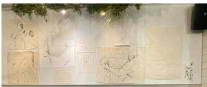
Teckningar på papper. 2020-2022 Varierande dimensioner.