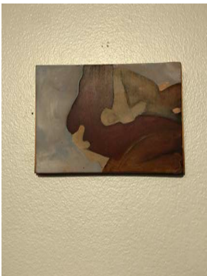
"Fragmented Intimacy 4" Oljemålning på pannå. 2017. 12 x 17 cm