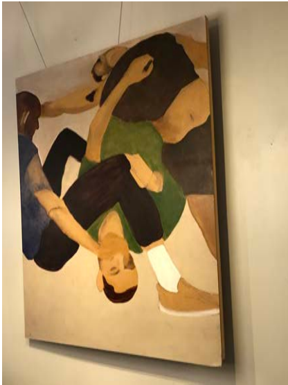
“Tre/Dom” Oljemålning på pannå. 2017. 120 x 90 cm