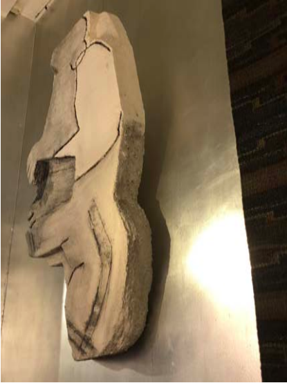
"Desire Lines 1" Frigolit, Jesmonite. 2020. 120 x 80 x 10 cm