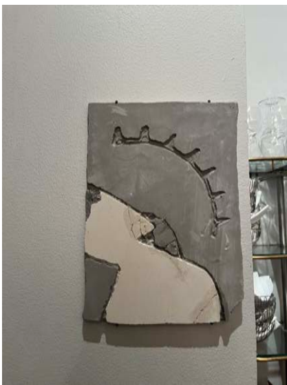
"Golvbrunn" Naturgips. 2021. 25 x 15 cm