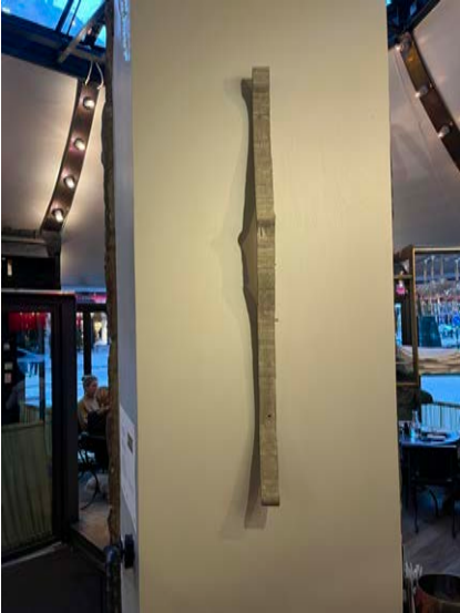
"Untitled" Väggskulptur, Armerad Betong. 2022. 90 cm