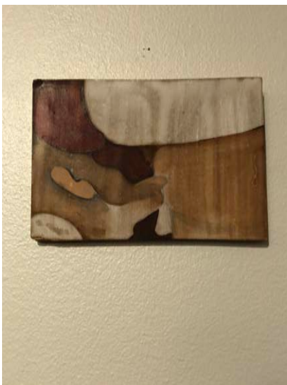
"Fragmented Intimacy 3" Oljemålning på pannå. 2017. 12 x 17 cm