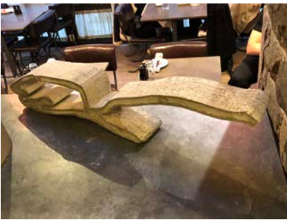
"Soft Hands" Skulptur, Armerad betong. 2022. 70 x 10 cm